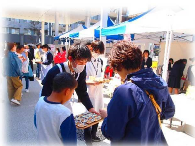
福祉科:介護食提供

本校からは、看護科・福祉科代表生徒によるレモネードスタンド募金(=小児がん啓発による募金)と、介護食の紹介・試食の提供を行い、地域の方々との交流の機会をもてました。