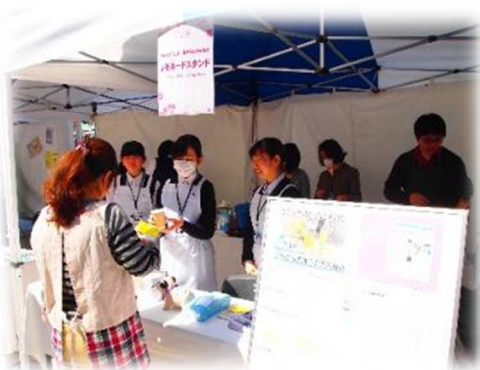
看護科:レモネードスタンド募金